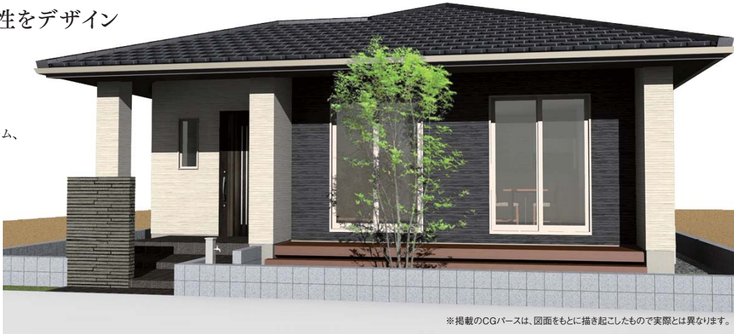
※掲載のCGパースは、図面をもとに描き起こしたもので実際とは異なります。

美しい大屋根がシンボルの平屋住宅。 ゆとりの80坪超の敷地を活かし、 20.8帖の開放的なリビング、 お客様の成長に合わせて使える2ドア1ルーム、 豊富な収納、4台駐車可能など、 機能性の高い暮らしを提案します。 洗面室に隣接した洗濯物干しデッキや リビングの多目的カウンターも魅力。 一年中快適に暮らせる断熱性も ぜひ体感ください。